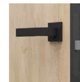
A zár elülső része