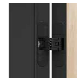
3D pántok a tokkal megegyező színben