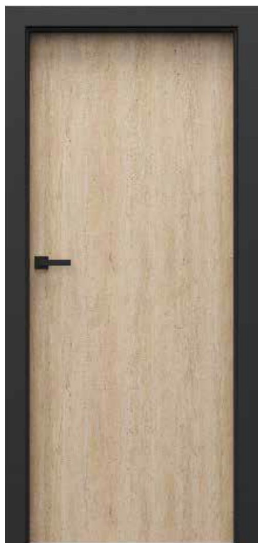
Porta LOFT, Skandináv Bükk

A Porta LOFT egy olyan kollekciónak, amely új perspektívákat nyit meg a belsőépítészetben. Ennek egyik fő oka a fekete matt fólia használata mind a tok és az összes tartozék számára. Köszönhetően a PORTA dekorációval való kombinációnak, saját eredeti terméket hozhat létre, amely könnyen beilleszthető szinte bármilyen belső térbe.