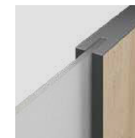
"éles szélű" üveg kombinálás